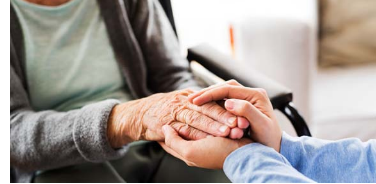
Geborgenheit und Vertrautheit