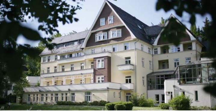
Die Celenus Dekimed