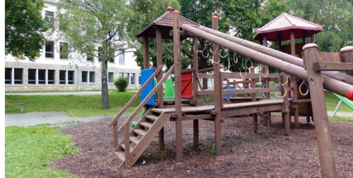
Grundschule Bad Elster mit Hort und Spielplatz