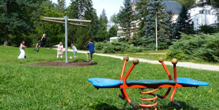
Spielplatz im Albertpark, neben der Klinik