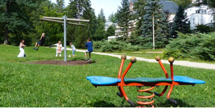
Spielplatz im Albertpark, neben der Klinik